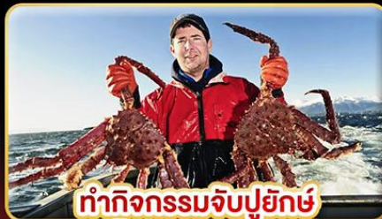
ทำกิจกรรมจับปูยักษ์ “พร้อมเมนูสุดพิเศษ”