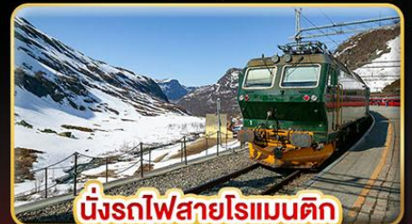
นั่งรถไฟสายโรแมนติก “พร้อมสปาานา”