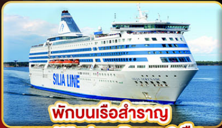
พักบนเรือสำราญ แบบ Window Room 2 คืน