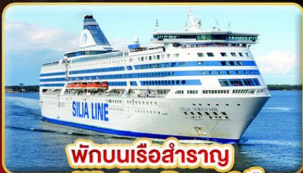
พักบนเรือสำราญ แบบ Window Room 2 คืน