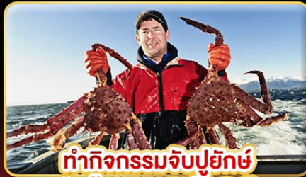
ทำกิจกรรมจับปูยักษ์ “พร้อมเมนูสุดพิเศษ”