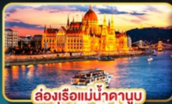
ส่องเรือแม่น้ำดานูบ ช่วง Twilight