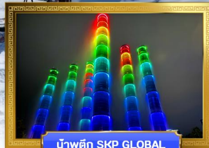
น้ำพุตึก SKP GLOBAL