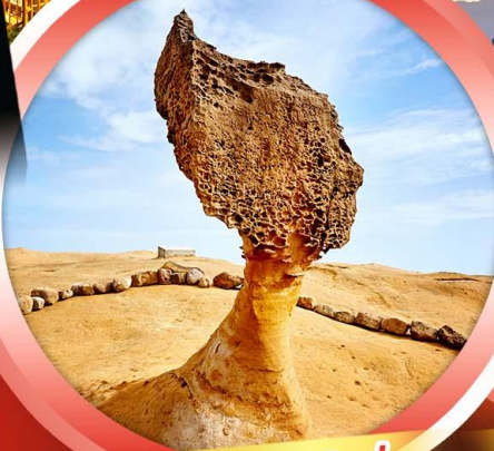
อุทยานแห่งชาติหยี่หลิว