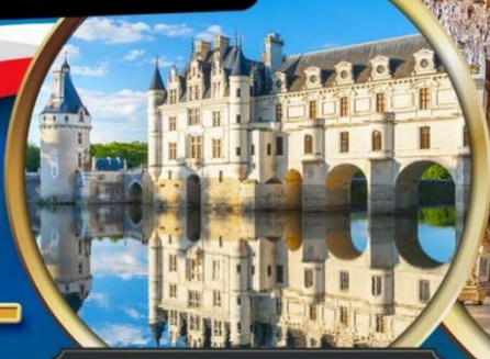
พระราชวังเชอนงโซ