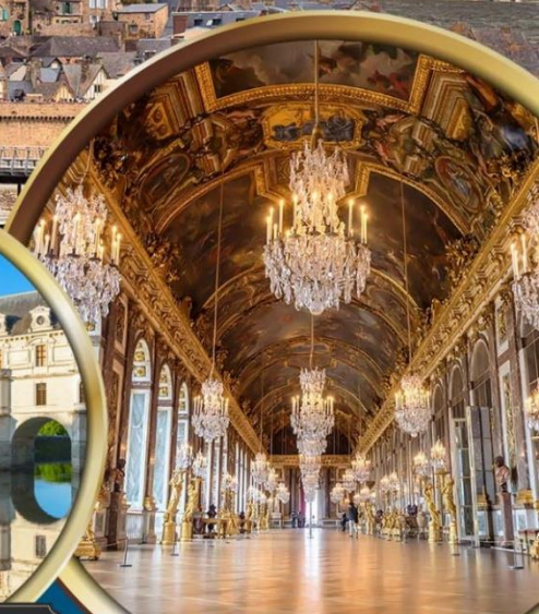
เข้าชม พระราชวังแวร์ซายน์