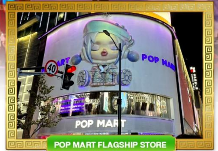
POP MART FLAGSHIP STORE