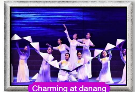
Charming at danang