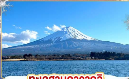
ทะเลสาบคาวากุจิ