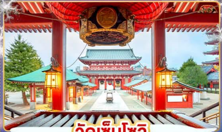
วัดเซ็นโซจิ

เที่ยวชมงานประดับไฟฤดูหนาว SAGAMIKO ILLUMINATION เช็กอินลานสกี ชมวิวภูเขาไฟฟูจิ