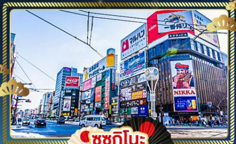
ซูซุกิโนะ