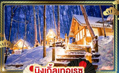
นิงเกิ้ลทอเรซ