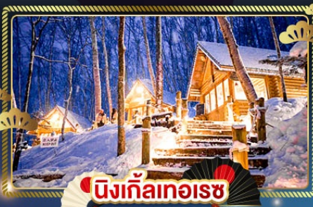
♨️ นิงเกิ้ลทอเรซ