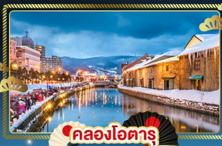
🏮 คลองโอตารุ