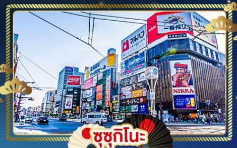
🍡 ซูซุกิโนะ