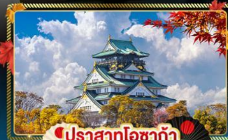
🍁 ปราสาทโอซาก้า