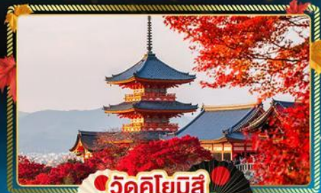
🍁 วัดคิโยมิจิ