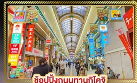
ช้อปปิ้งถนนทานุกิโคจิ