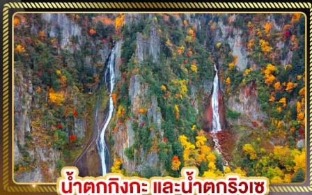
น้ำตกทิงกะ และน้ำตกริวเซ