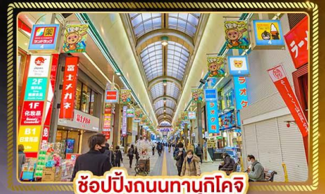
ช้อปปิ้งถนนทานุกุโคจิ