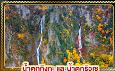
น้ำตกกิงกะ และน้ำตกริวซ