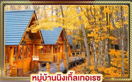
หมู่บ้านนิงเกิ้ลทอเรซ