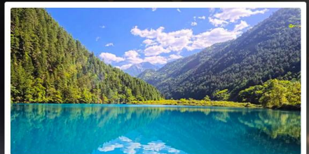
จิ่งจ้ายโกว