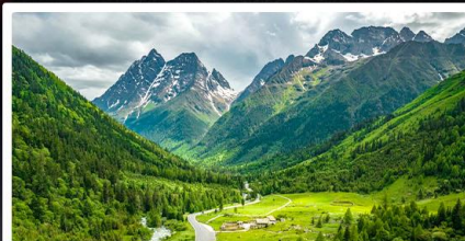
สี่ดรุณี