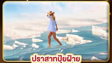
ปราสาทบิยูฝาย