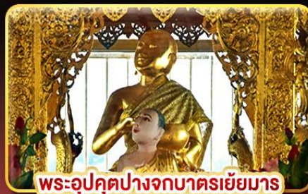
พระอุปคุตปางจกบาตรเยี่ยมาร