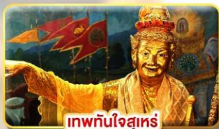
เทพทันใจสุเหร่า

โรงแรม เมืองย่างกุ้ง หรือเทียบเท่า 5 ดาว