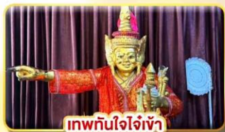
เทพทันใจใจเจ้า