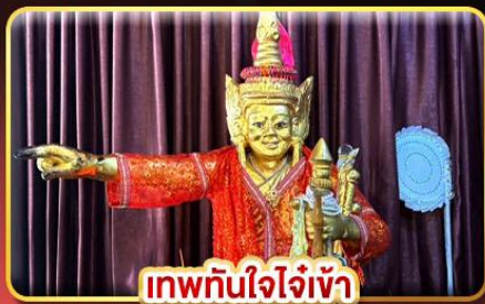
เทพทันใจใจเจ้า