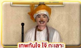
เทพทันใจ ใจ กะเลาะ