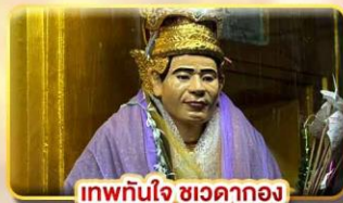
เทพทันใจ ชเวดากอง