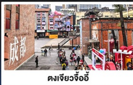
ตงเจียวจื่อ