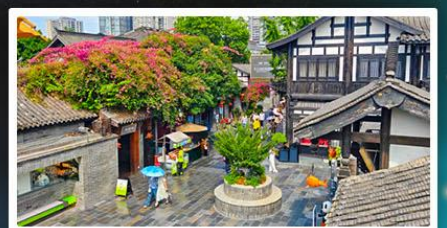
ถนนชอยกวางชอยแคว