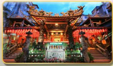
วัดเทียนโฮ่ว จอพริเจ้าแม่หม่าจู