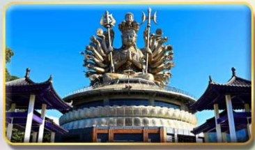
วัดกวนอิมหยวนเต้า