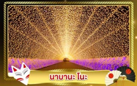
นาบานะ โนะ