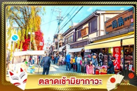
ตลาดซามิยากาวะ