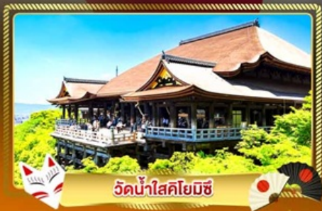
วัดน้ำใสคิโยมิชิ

ชมงานประดับไฟสุดอลังการ นาบานะ โนะ ซาโตะ