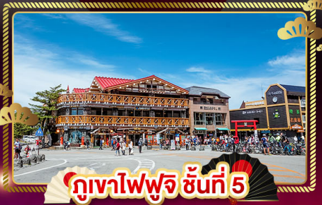
กุหาไฟฟูจิ ชั้นที่ 5

ชมลาวเอนเดอร์ ที่ สวนไอชิปาร์ค อิสระ 1 DAY TRIP