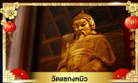
วัดเขกทมิฬ