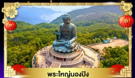
พระใหญ่องปิง