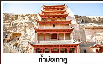
ถ้ำม่อเกาตุ