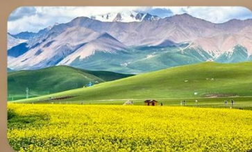
ทุ่งหญ้าซีเหลียน