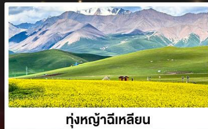
ทุ่งหญ้าจีเหลียน