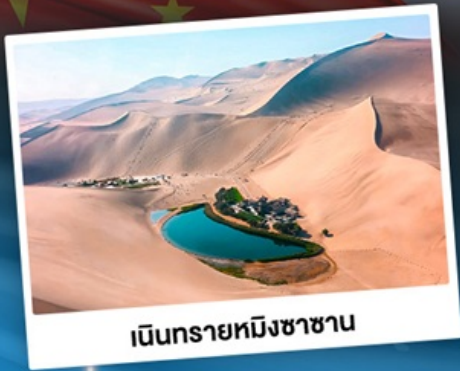
เนินทรายหิงซาซาน