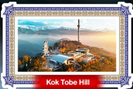
Kok Tobe Hill