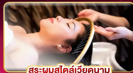
สระผมสไตล์เวียดนาม