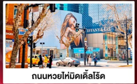
ถนนหวยไห่มีดัดส์โรด