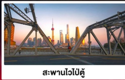
สะพานไวปี้ตู่