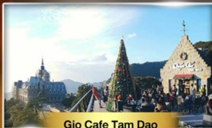
Gio Cafe Tam Dao