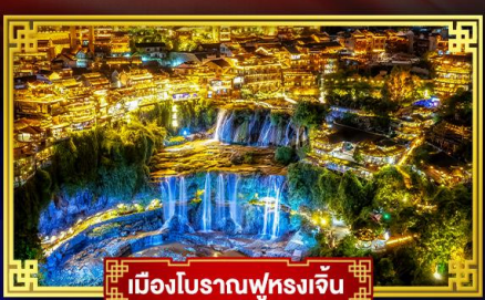
เมืองโบราณฟูงงเจิ้น

เที่ยว 2 เมืองโบราณ ตระกูลเมืองหิมะ "ICE & SNOW WORLD"