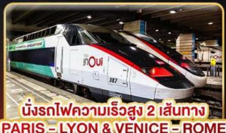
นั่งรถไฟความเร็วสูง 2 เส้นทาง PARIS - LYON & VENICE - ROME

📅 เดินทาง : 11-20 ก.พ. 68 / 15-24 มี.ค. 68 05-14 เม.ย. 68 / 29-08 พ.ค. 68