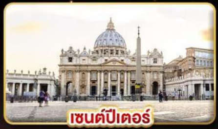
เซนต์ปีเตอร์