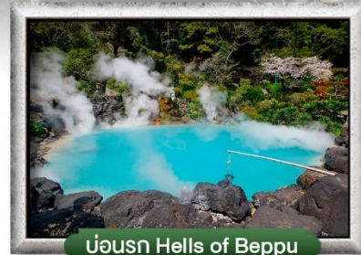
บ่อน้ำ Hells of Beppu