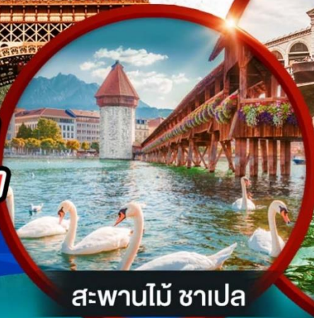
สะพานไม้ ชาเปล

วีซ่า ทิปท้องถิ่น ตัวประกันโรงแรม ห่วงหน้าทัวร์