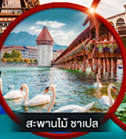
สะพานไม้ ชาเปล