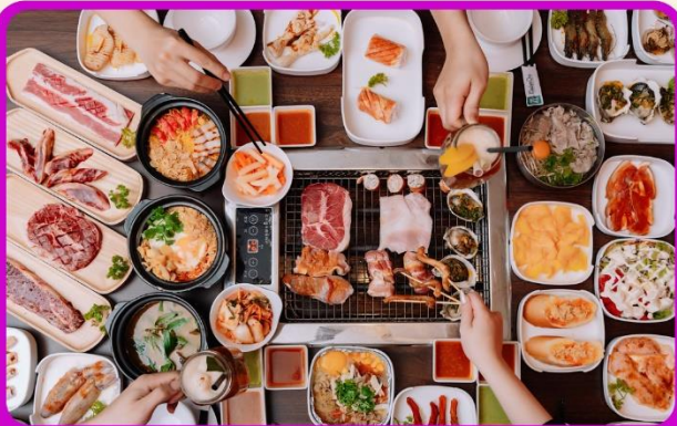
พิเศษ!! เมนูซาซิมิ+บุฟเฟ่ต์ปิ้งย่าง