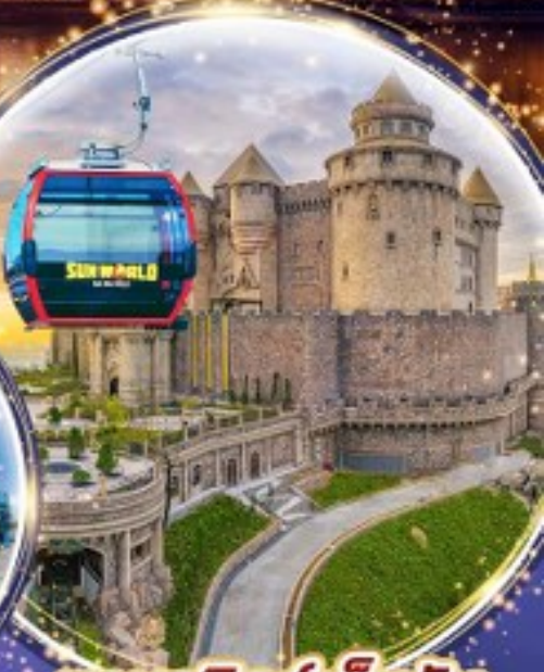
บานาฮิลล์เต็มวัน