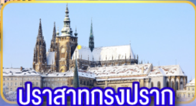
ปราสาทกรุงปราก