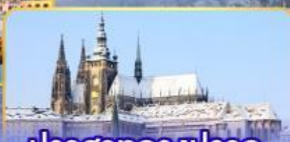
ปราสาทกรุงปราก