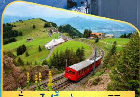
นั่งรถไฟขึ้นสู่ยอดเขาโรทิก