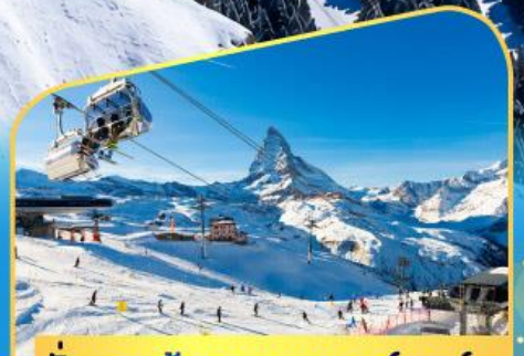
นั่งกระเช้าชมแมทเทอร์ฮอร์น