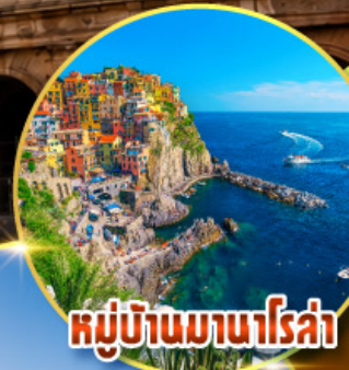
หมู่บ้านมานาโรซ่า

พิเศษ ลิ้มรสปาร์มาแฮมถึงเมืองต้นกำเนิดแท้ๆ