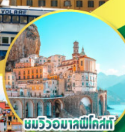
ชมวิวยามค่ำคืนที่โพซิโต