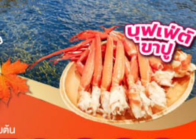
บุฟเฟ่ต์บายู

รวมจุดเช็คอินชมใบไม้เปลี่ยนสี โอซาก้า ชิซุโอะกะ ฟุจิ โตเกียว