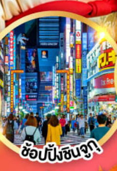
ช้อปปิ้งชุนจูกา