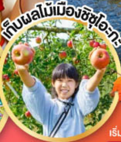
เก็บผลไม้เมืองชิซุโอะกะ