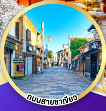
ถนนสายชาเขียว