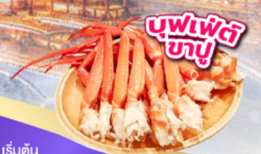
บุฟเฟ่ต์ ซาซุ