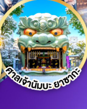
กาลจำนั่มะ ยาชากะ