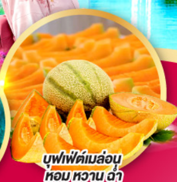
บุฟเฟ่ต์ผลไม้ หอมหวาน ฉ่ำ