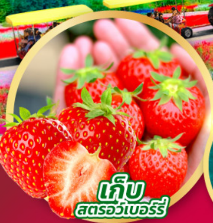
เก็บ สตอร์วเบอร์รี่