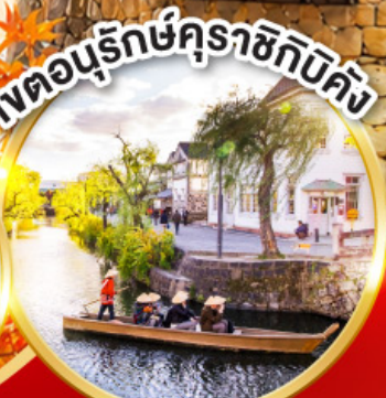
เขตอนุรักษ์คุราชิกิบิคัง