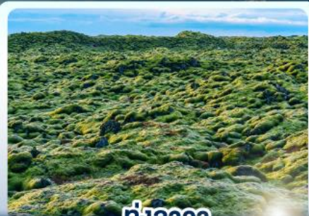
ทุ่งลาวา