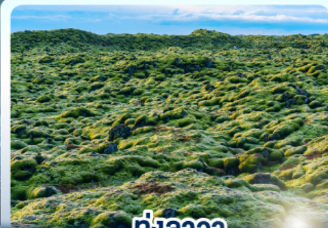
ทุ่งลาวา