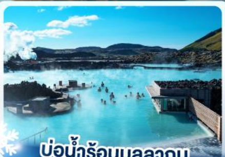
แช่น้ำร้อนบลูลากูน

เก็บไอซ์แลนด์ แดนภูเขาไฟคีร์กจูกูเฟล และ แช่น้ำร้อนบลูลากูน