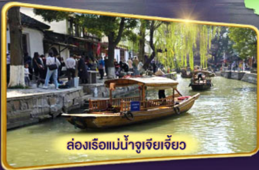
ล่องเรือแม่น้ำจูเจียงเจี๋ย