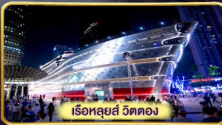
เรือหลุยส์ วิตตอง