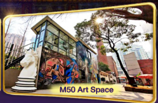
M50 Art Space