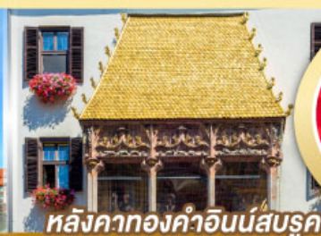
หลังคาทองคำอินน์สบูร์ค