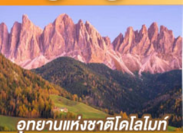
อุทยานแห่งชาติโดโลไมท์