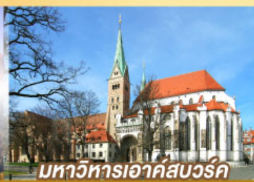
มหาวิหารเอาค์สเวิร์ค