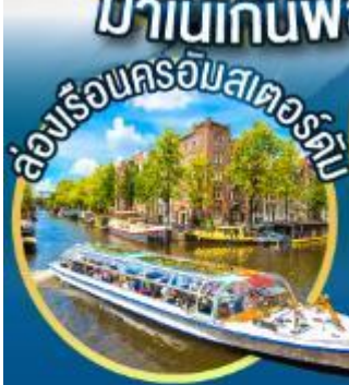
ล่องเรือนครอัมสเตอร์ดัม