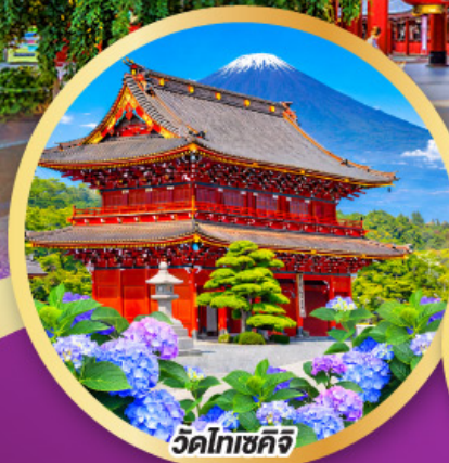
วัดโทเชคิจิ