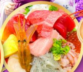
ตลาดปลาชิบิสึ คาชิโมะจิ