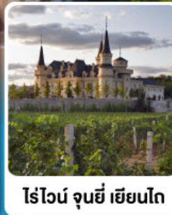
ไร่ไวน์ จุนยี่ เยียนโก