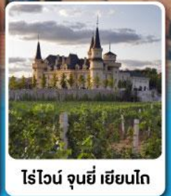
ไร่ไวน์ จุนยี่ เยียนไก