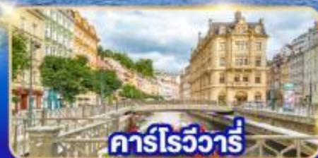
คาร์โรวารี