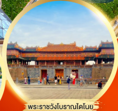
พระราชวังโบราณไดโนย