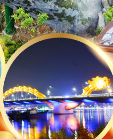
สะพานมังกรพันไฟ