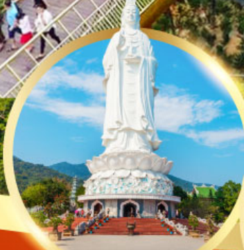
วัดหลิงอึ้ง