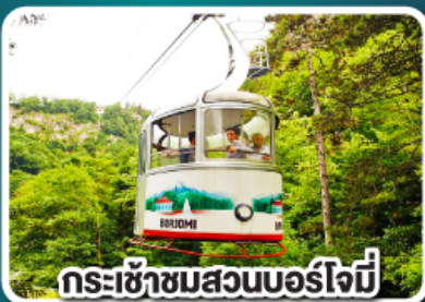
กระเช้าชมสวนบอร์โจมี