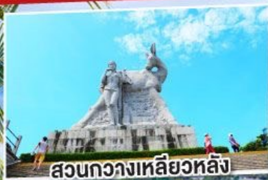
สวนกงวางเหลียวหลิง