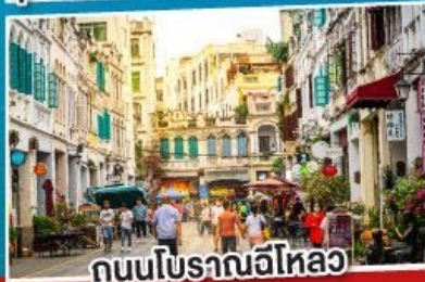
ถนนโบราณอีโหลว