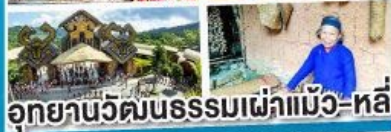
อุทยานวัฒนธรรมเผ่าแม้ว-หลี่