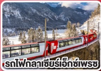
รถไฟกลาซีร์เอ็กเพรส