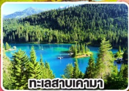
ทะเลสาบคาบา

เกาะดอกไม้ รถไฟธรรมชาติและมหาน้ำแข็ง สวิตเซอร์แลนด์ เยอรมนี 8 วัน 5 คืน