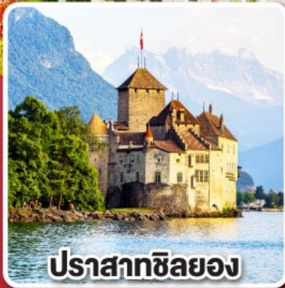
ปราสาทซิลยง

ชมหมู่บ้านดอกทานตะวัน ณ เกาะไมนา ประเทศเยอรมนี